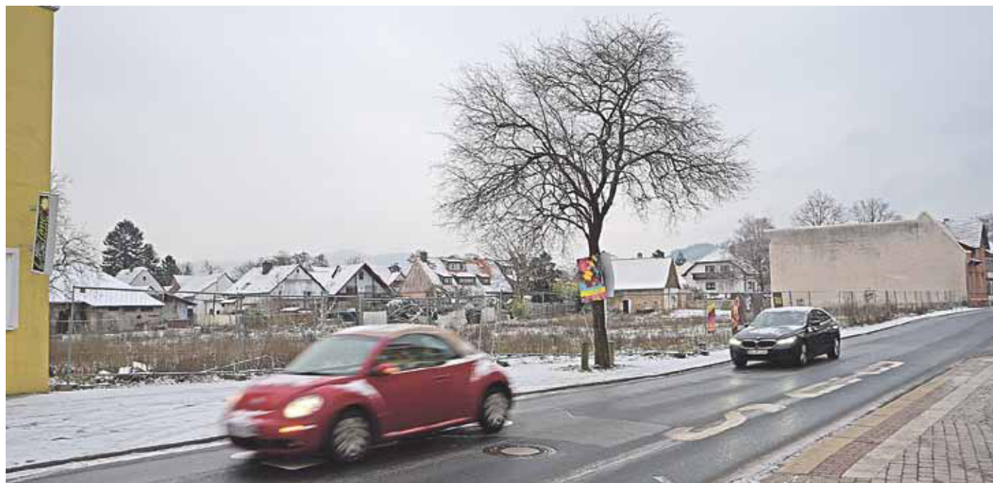
Noch liegt das Gelände für die „Neue Mitte“ in Bickenbachs Herzen brach (oben). Am Dienstag, 16. Februar, befasst sich der Planungs-, Landwirtschafts- und Umweltausschuss unter anderem mit den Einwendungen.

Neue Mitte: Planungsausschuss berät öffentlich über Einwendungen